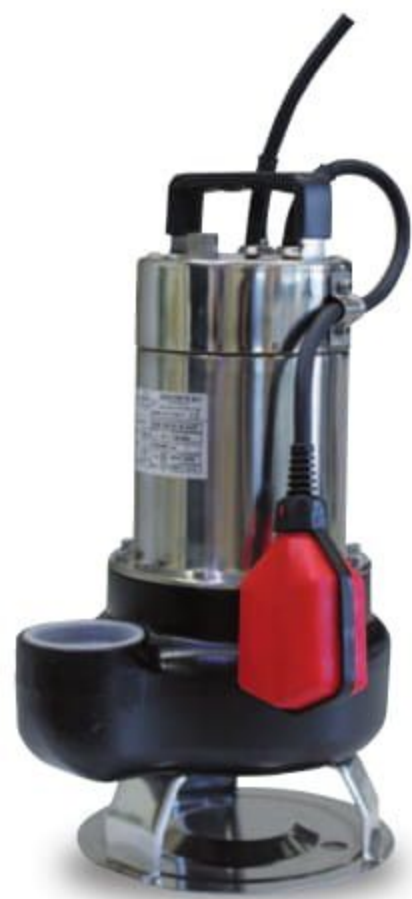
GXB 100 / 50 GXB 150 / 50 GXB 200 / 50